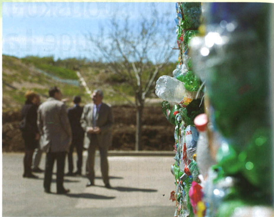
U učinkovitost krčkoga sustava gospodarenja otpadom ministar i njegovi suradnici uvjerali su se obilaskom reciklažnoga centra Treskavac

Kao što je poznato, cjelovit i ekološki zasnovan sustav gospodarenja otpadom na Krku je uveden sredinom 2005. godine, a prošla je poslovna godina, nakon desetljeća primjene novoga sustava, završena s udjelom od 50% odvojeno prikupljenog otpada po čemu je otok Krk vodeći u Hrvatskoj. Krčki model ministru Dobroviću dobro je poznat, s obzirom da je i