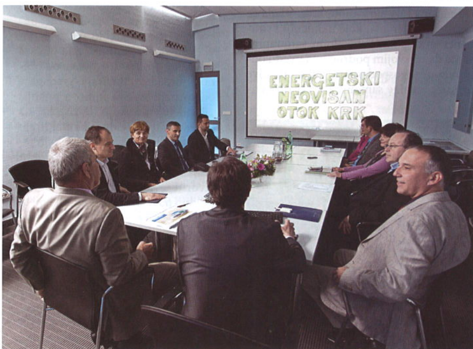
„Ponikve“ se s pravom mogu pohvaliti brojnim vrijednim postignućima, ali i jednakovrijednim projektima koji su u fazi realizacije

mouprave i „Ponikve“. Također, u sustav „od vrata do vrata“ već je uloženo dodatnih 3,65 milijuna kn, a do kraja 2017. godine uložiti će se još 8,1 milijun kn. U 10 godina primjene tog sustava, na otoku Krku prikupljene su čak 64.453 t razvrstanog otpada.